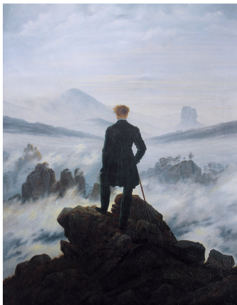
Le Voyageur au-dessus de la mer de nuages , Caspar David Friedrich (1774 - 1840)