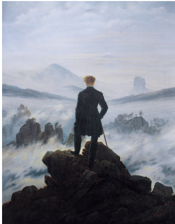
Le Voyageur au-dessus de la mer de nuages , Caspar David Friedrich (1774 - 1840)

Le versant littéraire Extension de l'ambitus Tensions harmoniques Flou artistique Virtuosité instrumentale Rubato Extension des formes